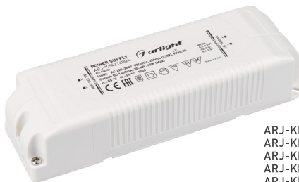
ARJ-KE70700 ARJ-KE86700 ARJ-KE481050 ARJ-KE571050 ARJ-KE301400 ARJ-KE361400 ARJ-KE421400A